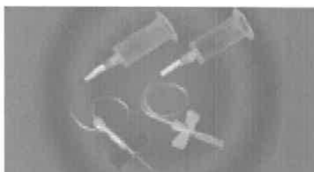
Игла-бабочка в сборе с держателем