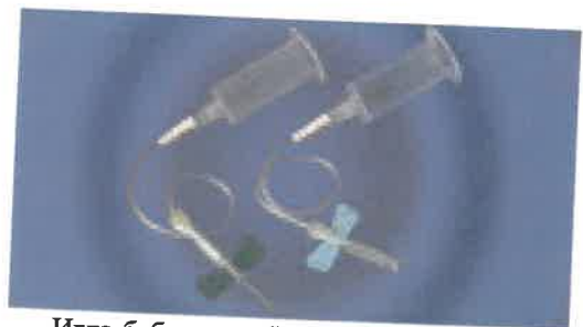
Игла-бабочка в сборе с держателем