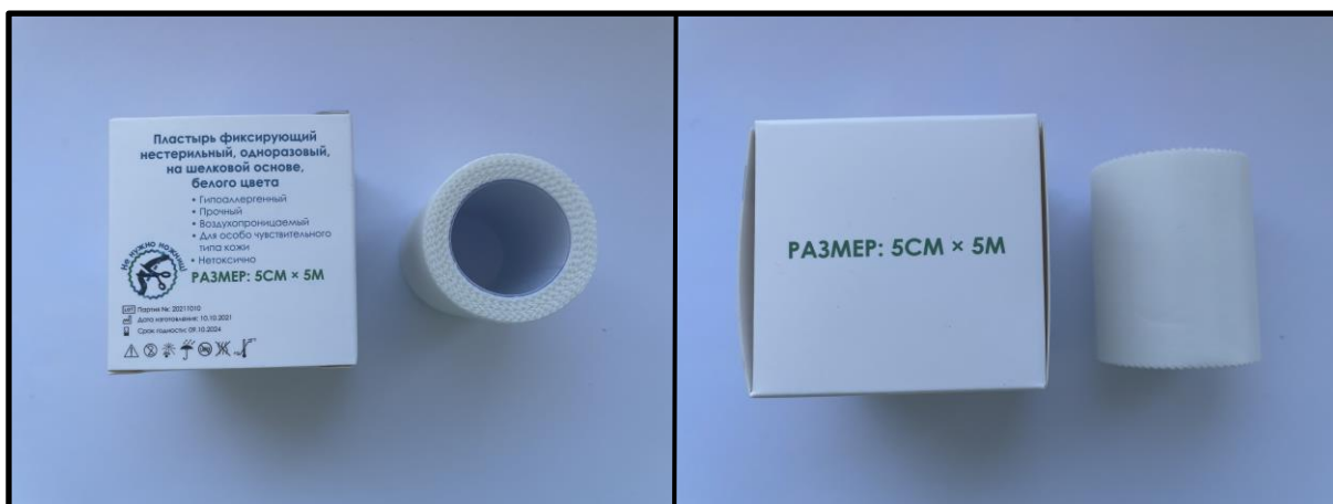
Фотографическое изображение №2 – Пластырь фиксирующий нестерильный, одноразовый, на шелковой основе, белого цвета: 5 см x 5 м (индивидуальная упаковка).